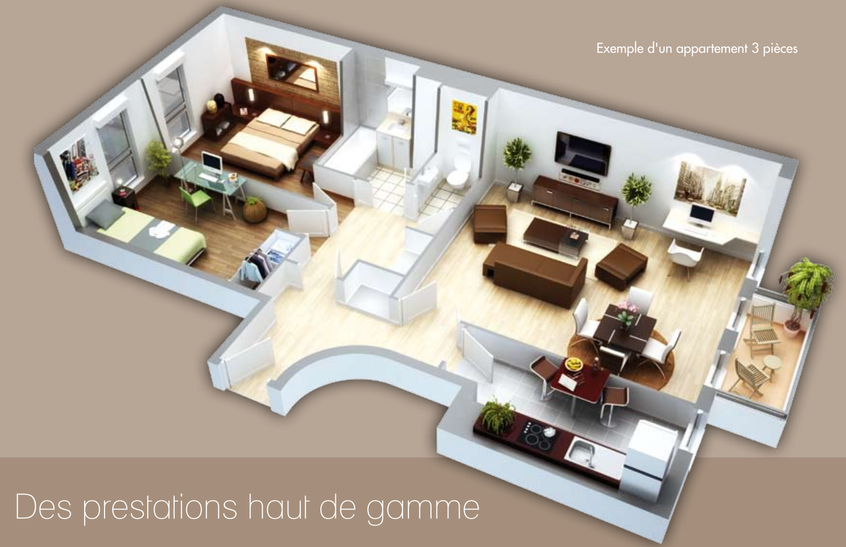
Exemple d'un appartement 3 pièces